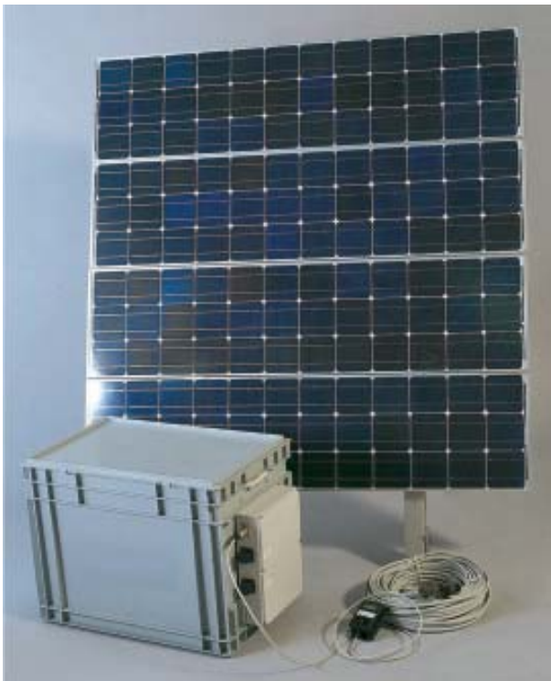
Le Power Pack Universel Naps est utilisé dans des cliniques, des écoles et autres projets d'électrification rurale.